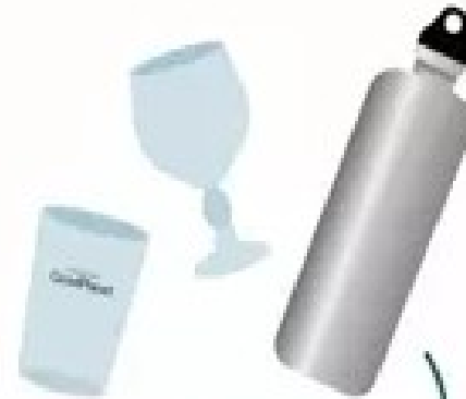
Ecocup Gourde ou thermos