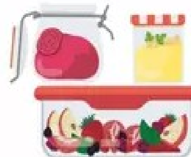
Bocaux en verre ou boîte réutilisable