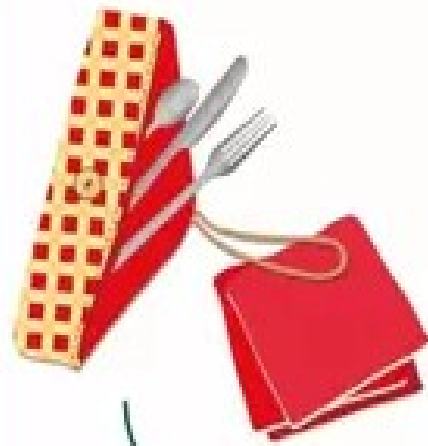
Kit de couvert Serviettes en tissu